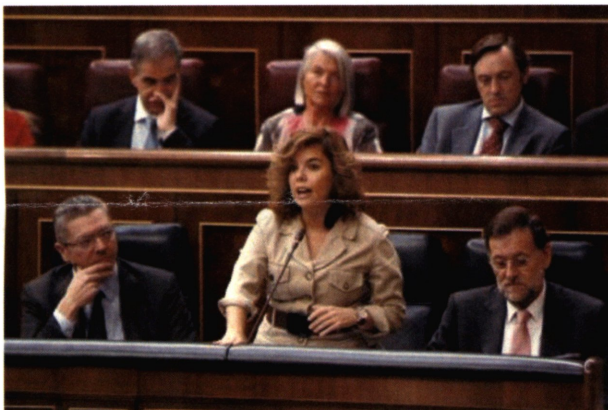
180 exdirectivos del sector público denuncian su despido ante el juez

CINCO DÍAS - MADRID - 14/09/2012 - 07:00